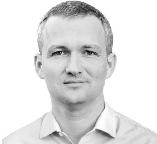
Юрій Левченко голова партії «Народовладдя», народний депутат України VIII скликання

Коли голова партії «Народовладдя» Юрій Левченко був народним депутатом України VIII скликання, жодне його голосування не було проти інтересів більшості українського народу, а всі подані ним законопроекти та тисячі поправок були в інтересах саме переважної більшості українців.